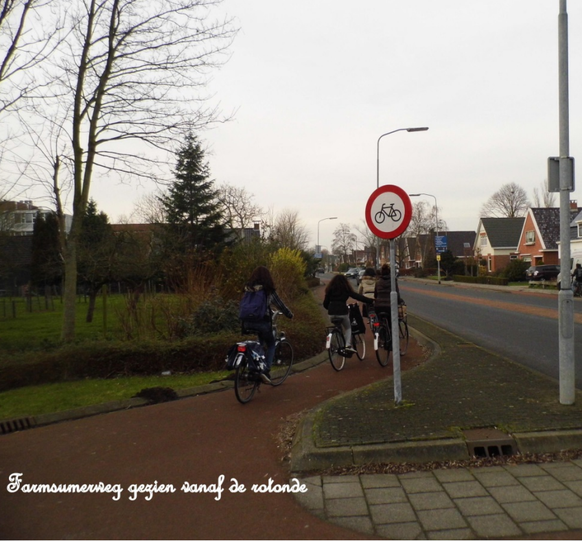
Farmsumerweg gezien vanaf de rotonde