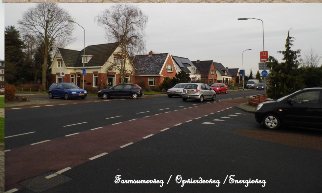
Farmsumerweg / Opwierderweg / Energierweg