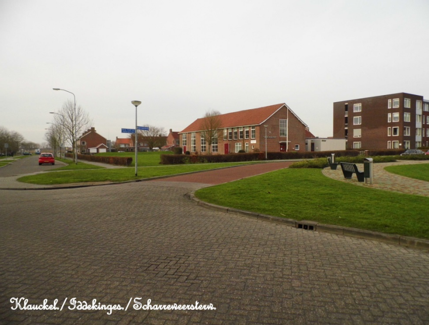
Klauckel / Eddekinges / Scharenreestern