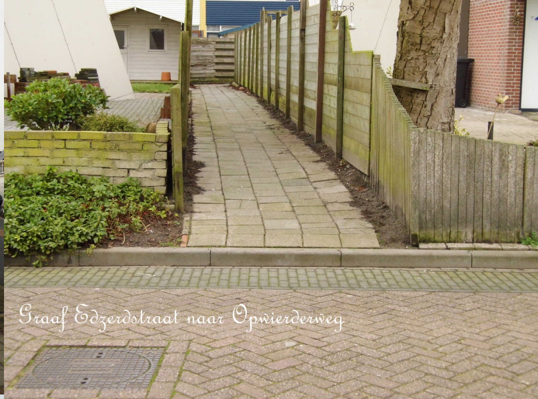
Graaf Edzerdstraat naar Opwierderweg