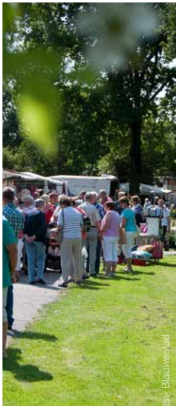
Fotografie: gemeente Oldambt en Pro Motion Pictures - Blauwestad