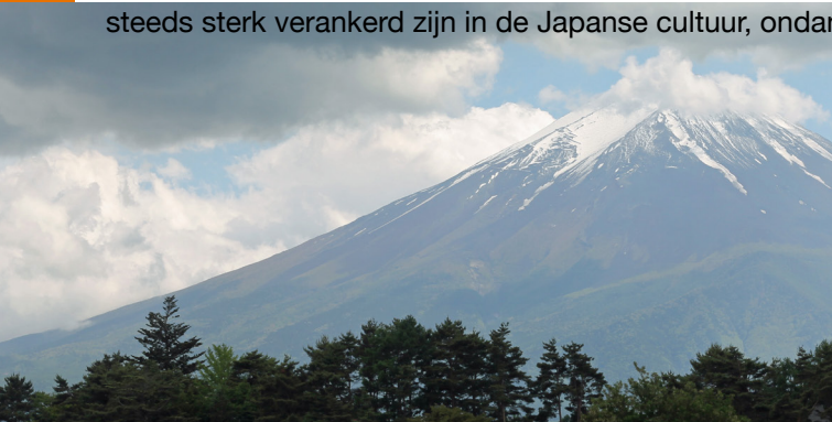
Eén van de gebergtes in Japan die het platteland lastig bereikbaar maakt.